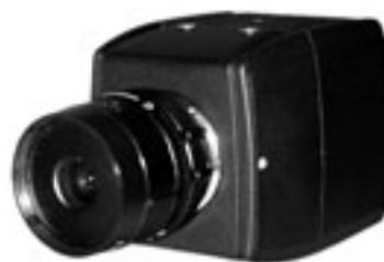
(OBIETTIVO NON FORNITO CON LA TELECAMERA)

La telecamera CCC1370H-2 è la più piccola telecamera digitale a colori Pelco con CCD. Il dispositivo CCD da 1/3" ad alta risoluzione della telecamera e il sensore immagini ad alta densità assicurano immagini chiare e nitide nelle situazioni più diverse.